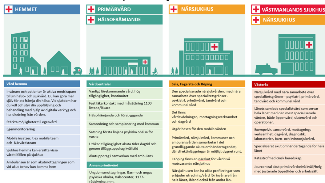
Tabell 1. Utbudsstruktur för hälso- och sjukvården i Region Västmanland 2029

Nedanstående text ger närmare beskrivning av vårdnivåer och föreslagna förändringar i vårdutbud.